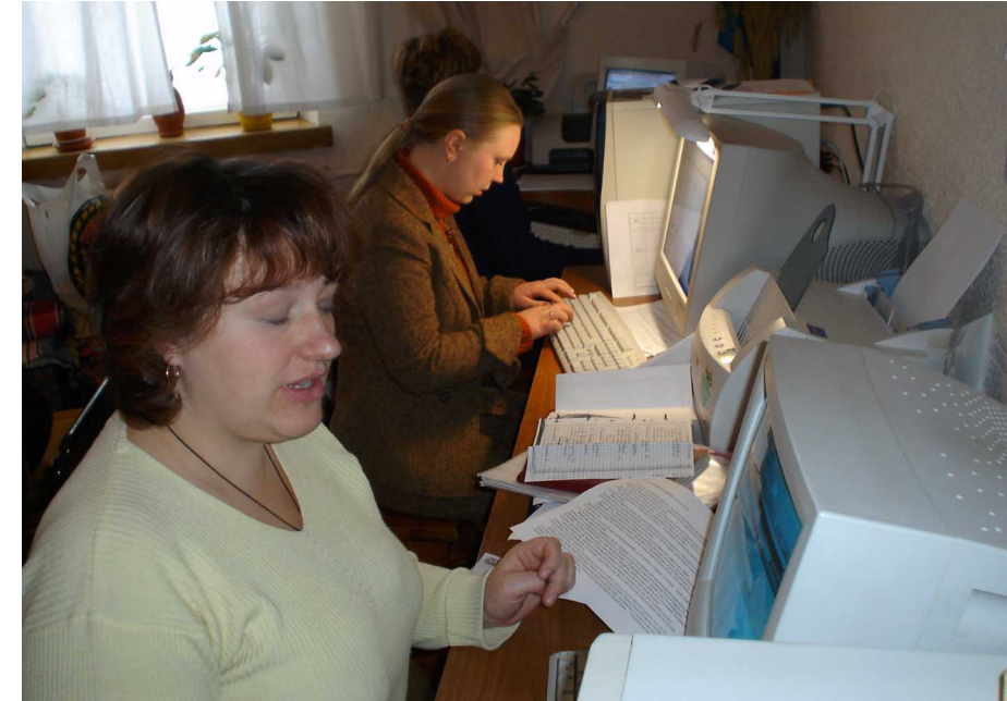
„Informationen zu bekommen, ist so nötig wie die Luft zum Atmen“