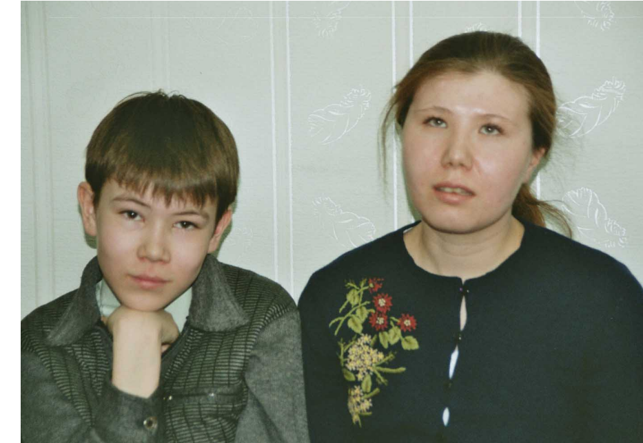
„Wir unterstützen uns gegenseitig“, freut sich Galina. „Nun ist das Leben nicht mehr so schrecklich – weil uns eine Chance geboten wird.“

Text: Claudia Bußmann