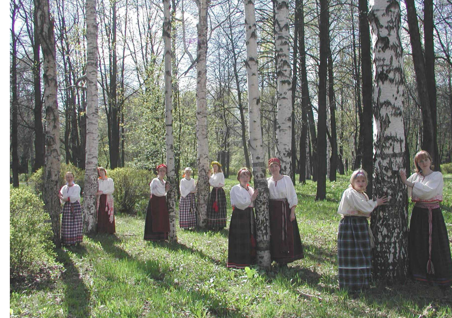
„Das LIENIP-Programm macht Mut und gibt uns Hoffnung. Hoffnung darauf, nicht länger im Abseits zu stehen. Und Hoffnung darauf, als indigene Völker eine Zukunft zu haben.“