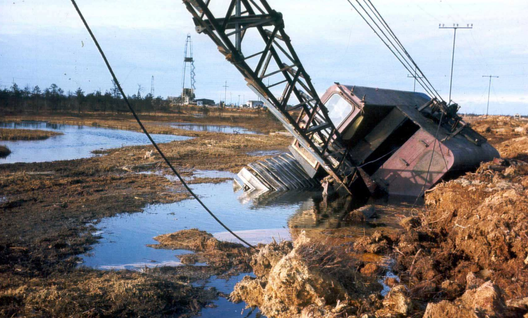
„Die Tiere, die sie jagen, sind ausgerottet. Die Fische und Vögel verschwinden. Die Wälder werden abgeholzt. Das Band ist zerbrochen, die Harmonie zwischen Mensch und Natur zerstört.“