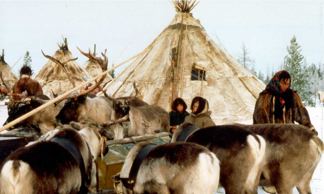
Heute ist das Überleben ihrer Kulturen eines der zentralen Anliegen Indigener Völker, um wieder in Würde ein selbstbestimmtes Leben führen zu können.